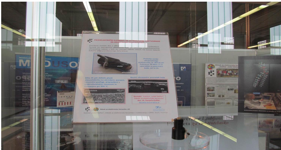
Piezoelektrični elementi za ultrazvočne pretvornike za medicinsko diagnostiko je predstavil odsek K5 Instituta Jožef Stefan

Kemijski inštitut v Ljubljani drugi partnerji so se predstavili v okviru sejma z video promocijskim in drugim gradivom. Medijska pokrovitelja naše predstavitve sta bila, IRT 3000 in revija Ventil, ter KVADRATI.