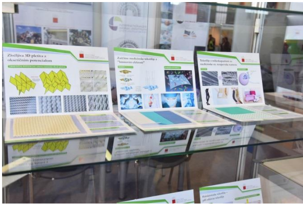
Predstavitev pametnih tekstilij (NTF – Univerza v Ljubljani)