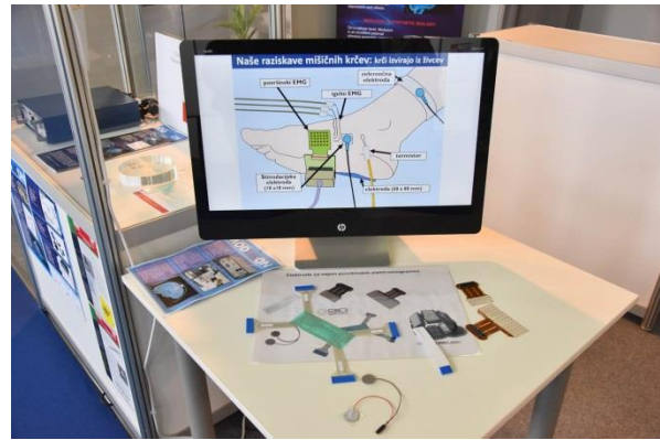
Zajem površinskih elektromiogramov, (FERI – Univerza v Mariboru)