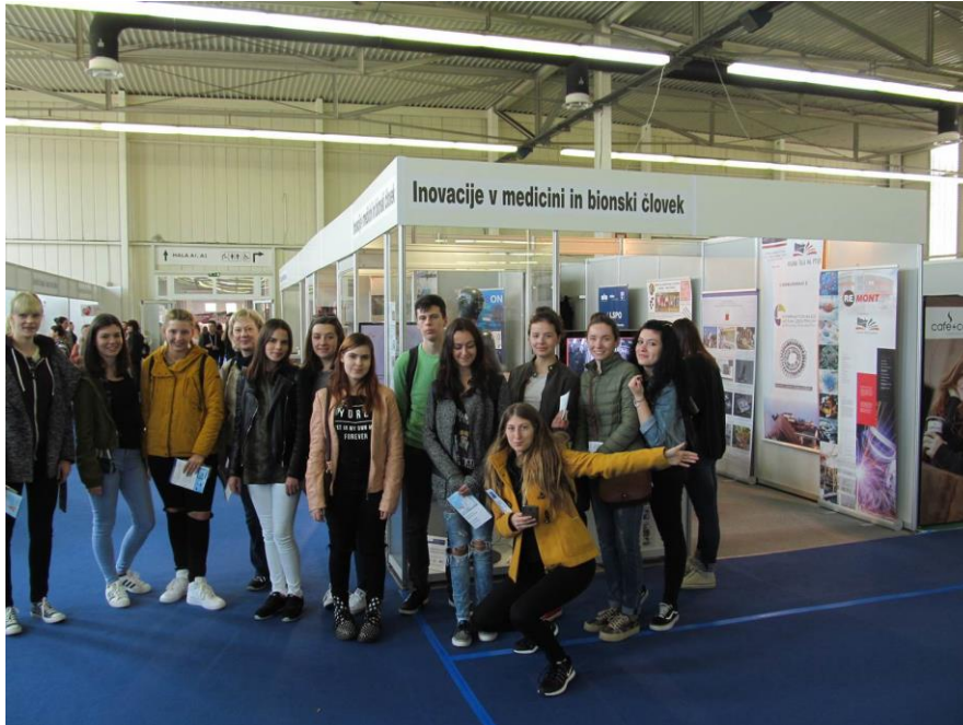
Razstavní prostor z inovacijami je bil odlično obiskan

Nadalje so bile predstavljene medicinske tekstilije: odzivne tekstilije s hidrogelom, samočistilne tekstilije, aktivne in pasivne protimikrobne tekstilije, tekstilni senzori, terapevtske tekstilije, oksetične tekstilije (UL, Naravoslovnotehniška fakulteta, Oddelek za tekstilstvo, grafiko in oblikovanje); napredni vmesniki mišice - stroj za neinvazivno identifikacijo in analizo kontrolnih strategij skeletnih mišic v zdravih preiskovalcih in bolnikih s pomočjo zajema in analize večkanalnih površinskih elektromiogramov (UM, Fakulteta za elektrotehniko, računalništvo in informatiko); mikrofluidni generator mehurčkov ali kapljic s planarnim pretočnim fokusiranjem, mikrofluidni čip s pnevmatsko krmiljenimi elastomernimi ventili, mikrofluidni čip z vgrajenimi elektrodami za biosenzorje, prototip fotopletizmografa za neinvazivno spremljanje kroničnega venskega popuščanja, mikrofluidna pripirna črpalka z enim "PZT" aktuatorjem - in vivo (patent) (UL, Fakulteta za elektrotehniko); piezoelektrični elementi za ultrazvočne pretvornike za medicinsko diagnostiko je predstavil odsek K5 Instituta Jožef Stefan.