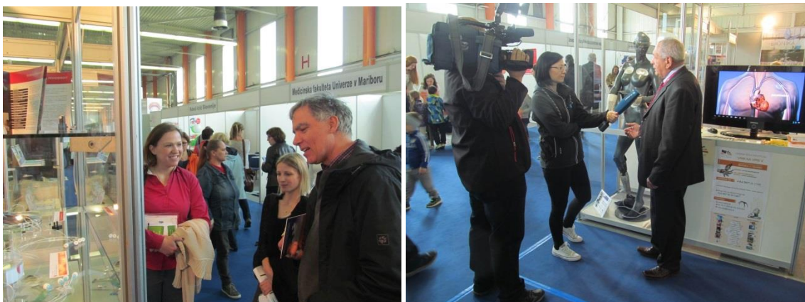
Odličen obisk razstavnega prostora z inovacijami v medicini, bionskim človekom kot razvojnim projektom za izobraževalne namene

Nadalje so bile predstavljene medicinske tekstilije: odzivne tekstilije s hidrogelom, samočistilne tekstilije, aktivne in pasivne protimikrobne tekstilije, tekstilni senzori, terapevtske tekstilije, oksetične tekstilije (UL, Naravoslovnotehniška fakulteta, Oddelek za tekstilstvo, grafiko in oblikovanje); napredni vmesniki mišice - stroj za neinvazivno identifikacijo in analizo kontrolnih strategij skeletnih mišic v zdravih preiskovalcih in bolnikih s pomočjo zajema in analize večkanalnih površinskih elektromiogramov (UM, Fakulteta za elektrotehniko, računalništvo in informatiko); mikrofluidni generator mehurčkov ali kapljic s planarnim pretočnim fokusiranjem, mikrofluidni čip s pnevmatsko krmiljenimi elastomernimi ventili, mikrofluidni čip z vgrajenimi elektrodami za biosenzorje, prototip fotopletizmografa za neinvazivno spremljanje kroničnega venskega popuščanja, mikrofluidna pripirna črpalka z enim "PZT" aktuatorjem - in vivo (patent) (UL, Fakulteta za elektrotehniko); piezoelektrični elementi za ultrazvočne pretvornike za medicinsko diagnostiko je predstavil odsek K5 Instituta Jožef Stefan.